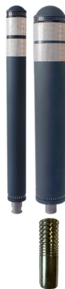
ø80 og ø130 med adapterrør

Vi introducerer også den nye version af SR CITY BALI pullerten med solcelle drevet lys. De 8 solcelle drevne dioder giver et klart lys om natten og indikerer forhindringer som cykelstier eller vej bump. Denne model har samme bøjelige egenskaber som den traditionelle version og fås også med blinkende lys.